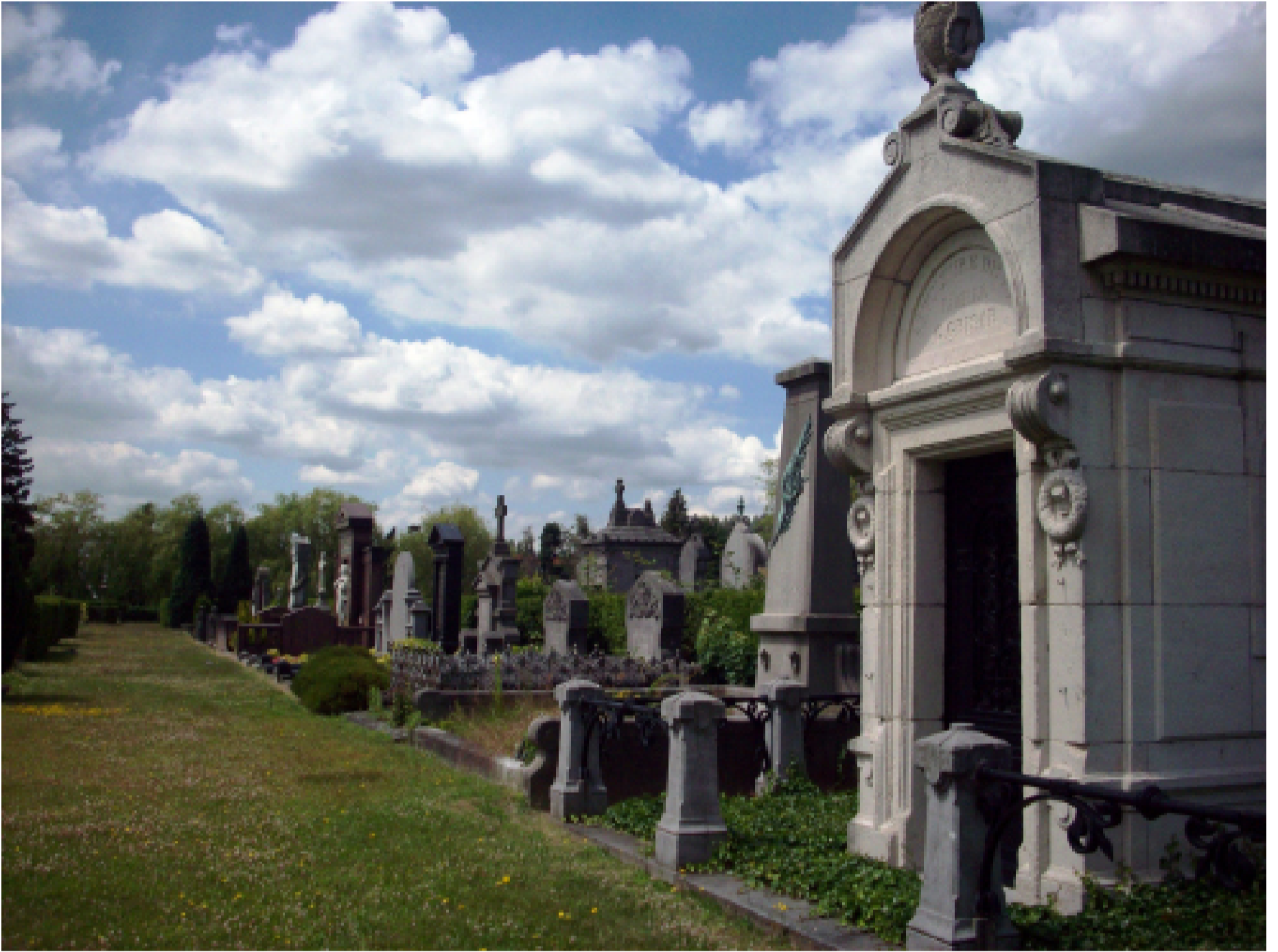
Het Antwerpse Schoonselhof, rustplaats van vele bekenden

De begraafplaats Schoonselhof is de grootste Antwerpse begraafplaats. Het is niet zomaar een begraafplaats, eerder een groot park waar men tot rust kan komen tussen de graven. Het vormt de rustplaats van vele bekende Antwerpenaren over de jaren heen uitgedroefd tot een echt begraafpark.